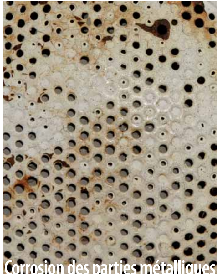
Corrosion des parties métalliques