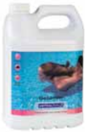
« Spécial piscines à liner »