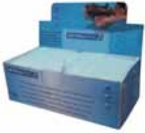
Cartouche de floculant (enveloppé d'un film plastique micro-perforé)