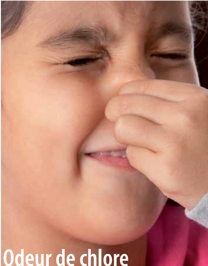
Odeur de chlore