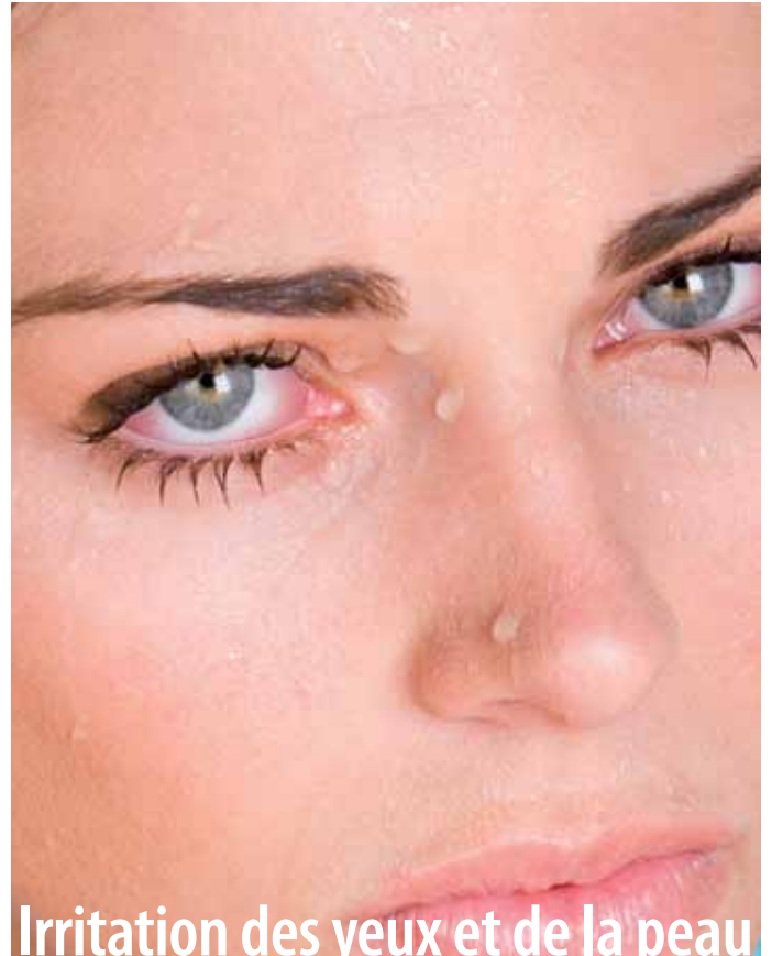
Irritation des yeux et de la peau